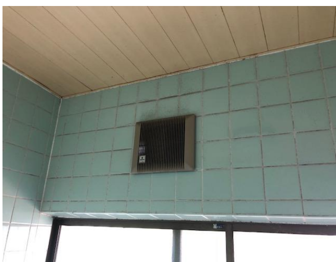
浴室 換気扇周り 清掃前