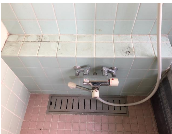
浴室シャワー水栓周り 清掃前