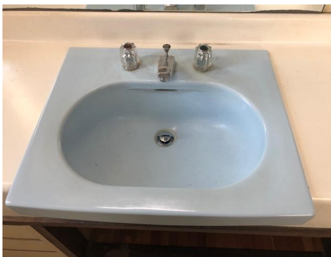
洗面（使用年数）30 年 清掃前