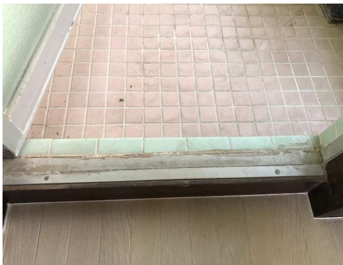
浴室入り口（使用年数）清掃前