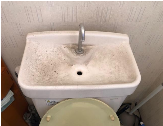
トイレタンクふた（使用年数 30 年） 清掃前