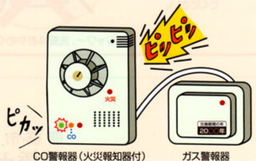
CO警報器(火災報知器付)

交換期限(5年)がすぎる前にお取替えが必要です。ご不明な点がございましたらガス事業者へ問い合わせください。